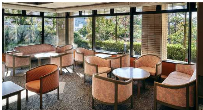
ガラス張りの解放感溢れるラウンジ

名湯に浸かりながら、静かな時間を過ごせる大人の隠れ家的ホテル、有馬温泉ソサエティ新館。落ち着いた癒しの空間に佇む開放感溢れる露天風呂。その名湯を誰に気兼ねすることなくじっくり堪能できるのは何よりの贅沢なひとときです。