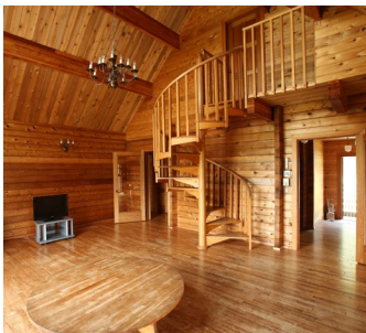
3棟あるコテージは1棟30名様まで宿泊可能