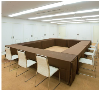
様々な形式のイベントや会議などに