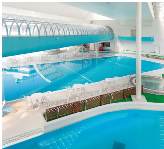
夏にはプールもお楽しみいただけます