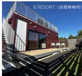
& RESORT (会員様専用)