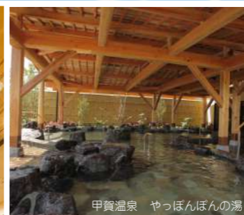
甲賀温泉 やっぽんぽんの湯