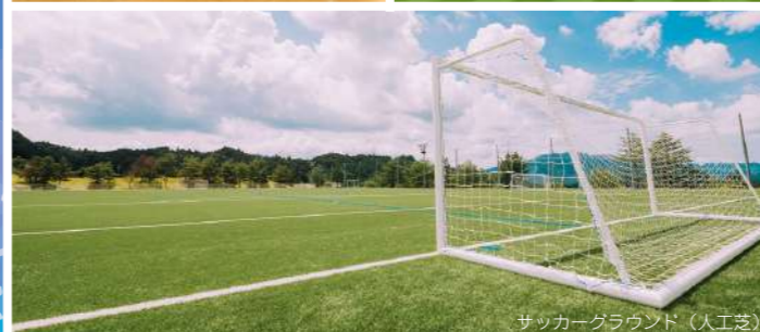
サッカーグラウンド(人工芝)