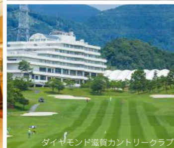
ダイヤモンド滋賀カントリークラブ