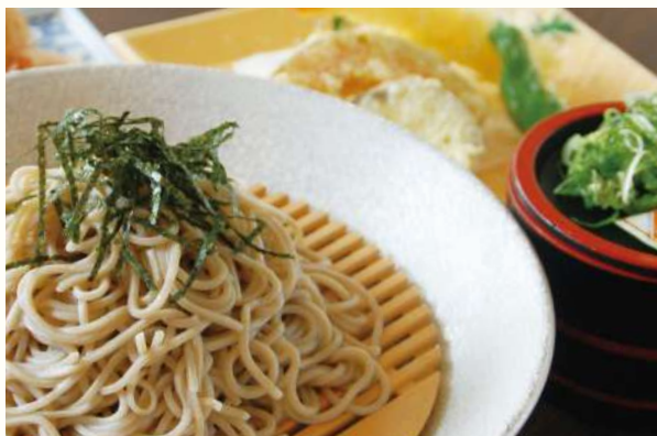
ランチの定番 天ざる蕎麦 or うどん いなり寿司付き