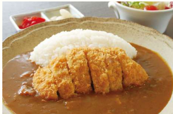
カツもカレーも食べたいときには 熟成三元豚のカツカレー ミニサラダ付き