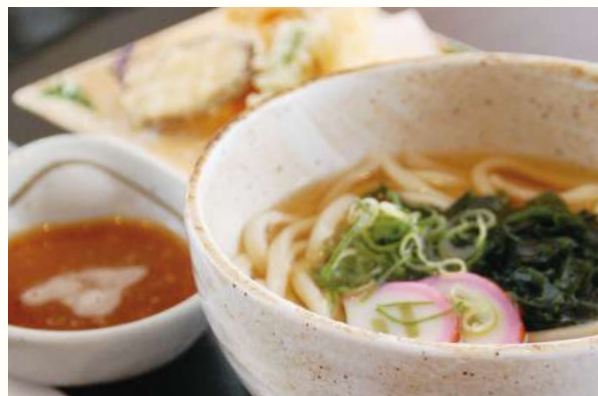
出汁香る 天ぷらうどん or 蕎麦 いなり寿司付き