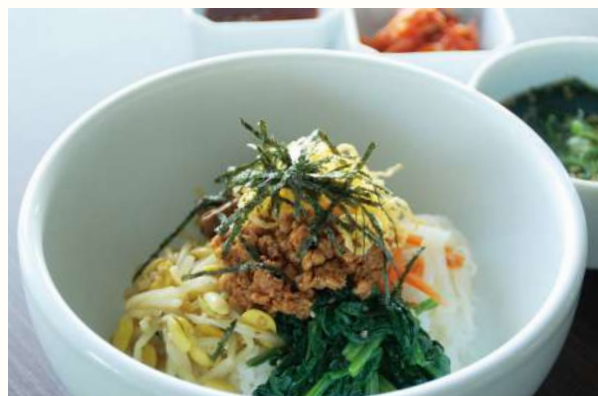
韓国料理の定番 自家製肉味噌乗せビビンバ わかめスープ付き