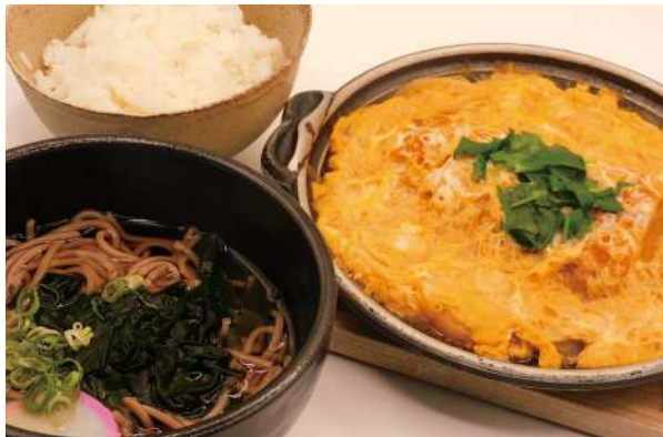
人気のセットメニュー かつ玉とミニ温蕎麦セット ご飯・香の物・ミニ温蕎麦付き